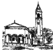
Parrocchia "Sant'Andrea Apostolo"