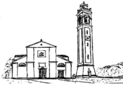
Parrocchia "Santa Maria Assunta" Casale sul Sile - Treviso