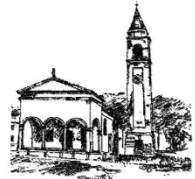
Parrocchia "Sant'Andrea Apostolo" Bonisiolo - Treviso